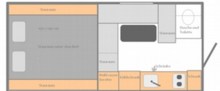
850 SC Popup